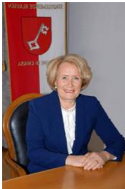
Die Bürgermeisterin und der Gemeindeausschuss

mit Mai 2020 endet die Amtsperiode des Gemeinderates und des Bürgermeisteramtes. Ein reichhaltiges Programm wurde umgesetzt, das Programm für die weiteren fünf Jahre wird in Zusammenarbeit mit Ihnen, werte Mitbürgerinnen und Mitbürger, erarbeitet werden. Der Ausschuss und ich persönlich danken dem Gemeinderat für die konstruktive Arbeit, allen Führungskräften und Bediensteten, und Ihnen allen. Auch für das kommende Jahr wünschen wir Ihnen Gesundheit, Glück und Wohlergehen. Danke für jede kleine und große Geste, die zu einem gelingenden Miteinander beiträgt. Zum Glück dürfen wir in unserer Gemeinde auf ein vorbildliches Engagement unserer Mitbürger*innen im Bereich der Nachbarschaftshilfe, des Caritativen und des Ehrenamtlichen zurückgreifen. Das verdient große Wertschätzung! Mögen für uns alle die freudigen, glücklichen Momente im neuen Jahr überwiegen. Alles Gute!